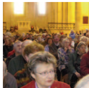
Concert de musique sacrée du XIX e et début XX e à la cathédrale de Nevers